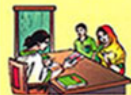
आई-एच-एन-सीपीओ का स्थान