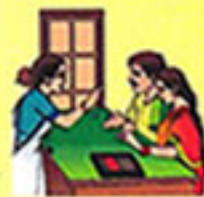
रोग संभाल की जगहों

किशोर-किशोरियों! स्वास्थ्य सेवाओं का लाभ तुम्हें भी उठाना है और जन-जन तक इसको पहुँचाना है ।