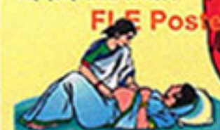
रोग पूर्व जीव